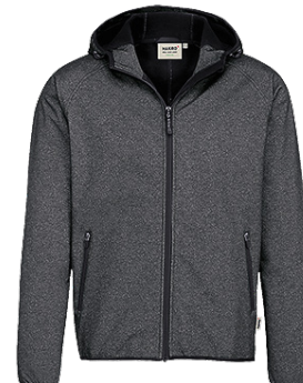
328 anthrazit meliert