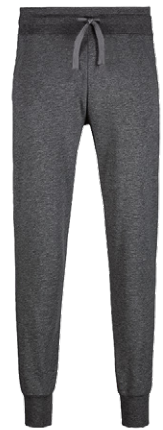
328 anthrazit meliert