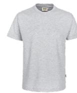
024 ash meliert