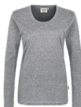
015 grau meliert